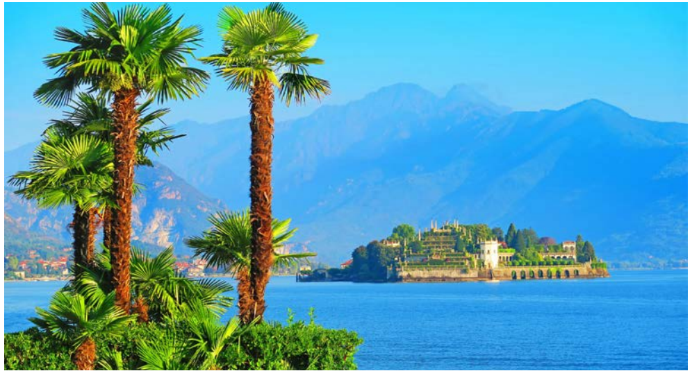
Die Isola Bella, „die schöne Insel“ im Lago Maggiore, hat sich ihren Namen redlich verdient

Freuen Sie sich auf einen Besuch der Ortschaft Cannobio am westlichen Ufer des Lago Maggiore, die