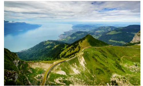
Blick vom Rochers de Naye auf den Genfer See