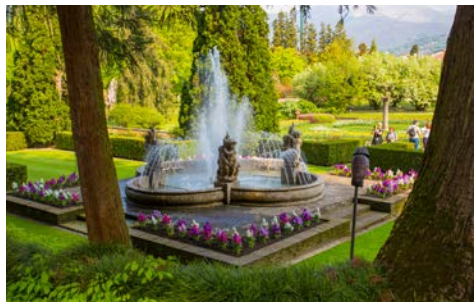
Botanischer Garten der Villa Taranto

vor allem mit ihren schönen Bürgerhäusern aus dem 16. und 17. Jahrhundert aufwartet. An der herrlichen Uferpromenade findet heute ebenfalls ein bunter Wochenmarkt statt. Heimische Spezialitäten wie Wurst, Käse, Fleisch oder Fisch, aber auch Kleider und Schmuck warten darauf, entdeckt zu werden. Anschließend fahren Sie am See entlang zu dem berühmten Botanischen Garten Villa Taranto. Mehr als 20.000 Pflanzen, teilweise sehr seltene Blumenarten, sind auf einem 20 Hektar großen Parkgelände zu sehen. Ein Besuch des botanischen Gartens ist wie eine Reise in ferne Länder und deren unendliche Schönheit der Natur.