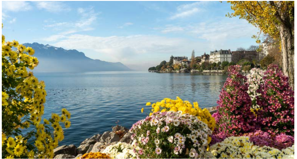
Die wunderschön gepflegte Blumenpromenade am Genfer See bietet gute Aussichten auf Montreux

Für einen schönen Spaziergang bietet sich die Seepromenade entlang des Genfer Sees bis zur Wasserburg „Château de Chillon“ in Veytaux an. Das auf einer Felseninsel gelegene Schloss Chillon ist mit seinen rund 300.000 Besuchern pro Jahr das meistbesuchte historische Gebäude der Schweiz. Die imposante Schlossanlage erreichen Sie über eine Holzbrücke aus dem 18. Jahrhundert.