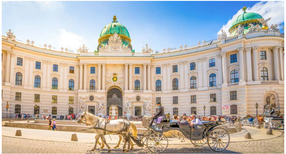
Willkommen in Wien mit der traumhaften Hofburg

*Liegeplatz je nach Verfügbarkeit in Weissenkirchen oder Spitz.