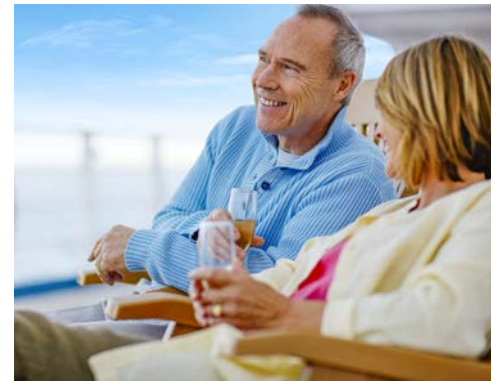
Genießen Sie das Bordleben