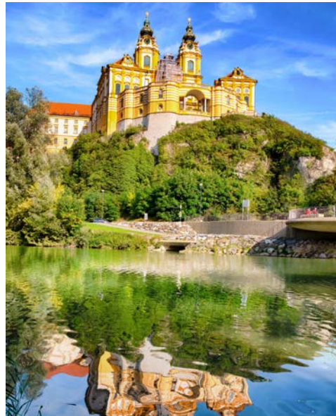
Das Barockstift Melk

sich ihren gotisch-barocken Stil weitgehend bewahren können. Der gotische Martinsdom war lange Zeit Krönungsort der ungarischen Könige. Die gemütliche Innenstadt mit Ihren bezaubernden Kaffeehäusern laden zum Verweilen ein.