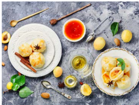
Probieren Sie unbedingt die leckeren Marillenknödel der Region

Egal, wo Sie nun anlegen, heute ist der Tag der Wachau! Lernen Sie auf einem möglichen Ausflug die Schönheiten dieser wunderbaren Landschaft mit ihren malerischen Weinhängen und idyllischen Orten kennen. Und was wäre die Wachau ohne ihre berühmte Marille? Verkosten Sie einen Marillenschnaps oder Likör.... oder vielleicht etwas Pikantes von der Marille? Die Produktion hat vieles zu bieten.