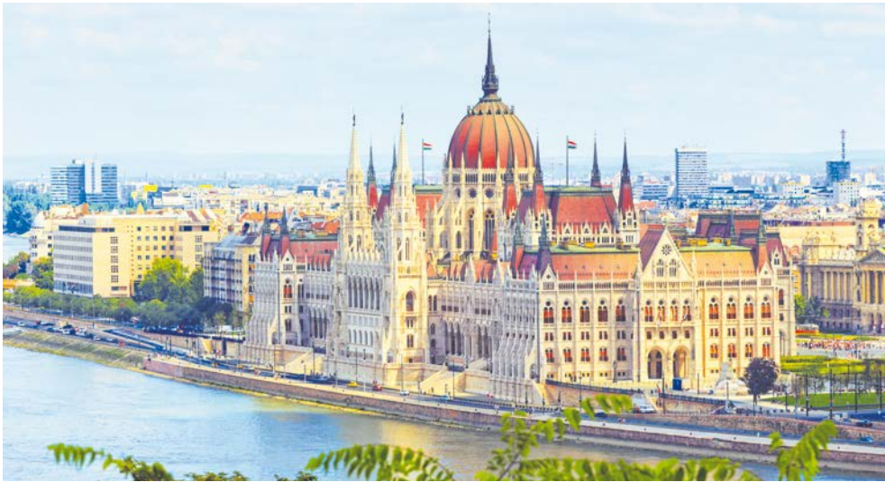
Das Parlamentsgebäude in Budapest