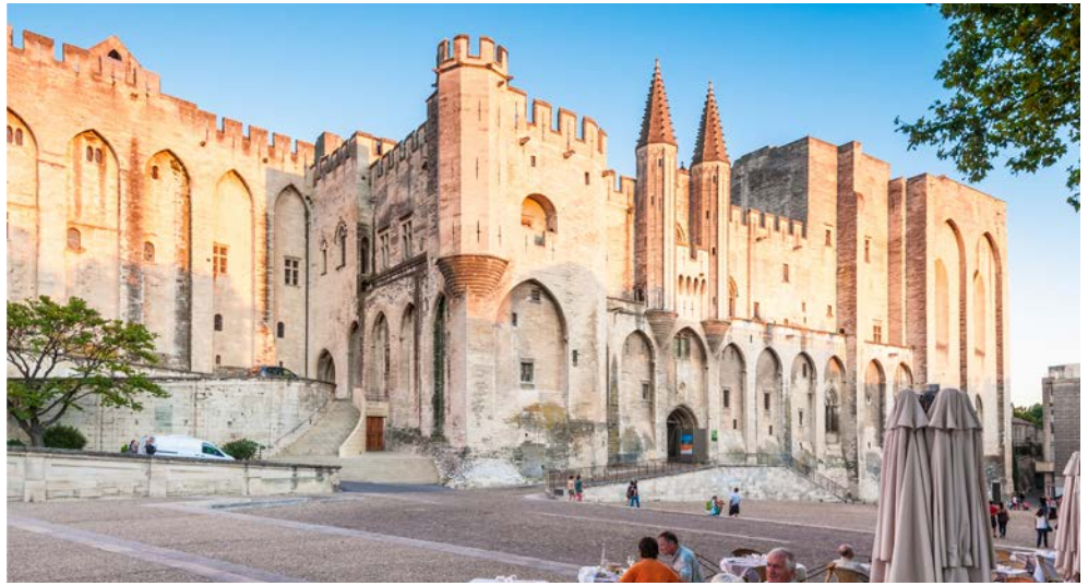
Papstpalast in Avignon

Entdecken Sie während dieser besonderen Reise die unterschiedlichen Genusspfade der französischen Küche. Mit den letzten warmen Sonnenstrahlen im Gepäck erkunden Sie die alte Papststadt Avignon, besuchen die bekannte Weinregion Châteauneuf-du-Pape und erleben einen der bekanntesten Trüffelmärkte Frankreichs im Dorf Richerenches. Immer samstags wird der „schwarze Diamant“ gehandelt. Gelagert im Heck der Autos der Trüffelbauern, transportiert in Plastiktüten und Sporttaschen, ausgebreitet auf Klappstischen, zeigt sich ein zeitweise skurriles „Handelsbild“ in den schmalen Straßen und Gassen. Erleben Sie das ursprüngliche Frankreich, abseits der touristischen Hotspots. Schnell wird bei den Besichtigungstouren deutlich, wie sehr französische Leichtigkeit und mediterraner Esprit das Leben in der Region bestimmen. Gerade in Städten wie Avignon und Aix-en-Provence zeigt sich Südfrankreich von seiner charmantesten Seite.