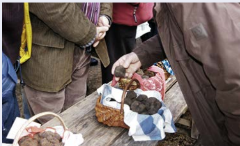
... und Trüffel