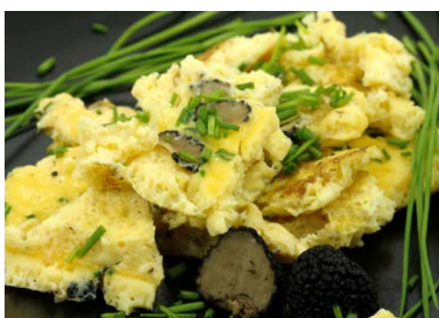
Exquisit – Trüffelomelette