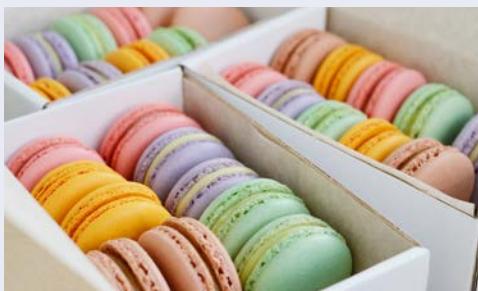
Französische Köstlichkeiten – Macarons ...