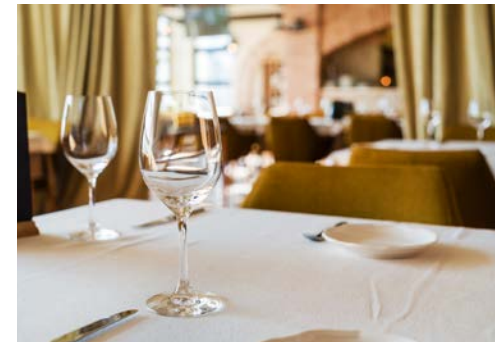
Im Sterne-Restaurant für Sie reserviert.

Am Vormittag erkunden Sie während eines geführten Stadtpaziergangs die malerische Altstadt von Avignon. Herausragend sind die romanische Kathedrale und die Ruine der Brücke Saint-Bénézet, die sich nur noch halb über die Rhône spannt. Das Herz der Stadt bildet der Place de l'Horloge. Anschließend nehmen Sie das gemeinsame Mittagessen in einem Sterne-Restaurant ein. Erleben Sie die Feinheiten der