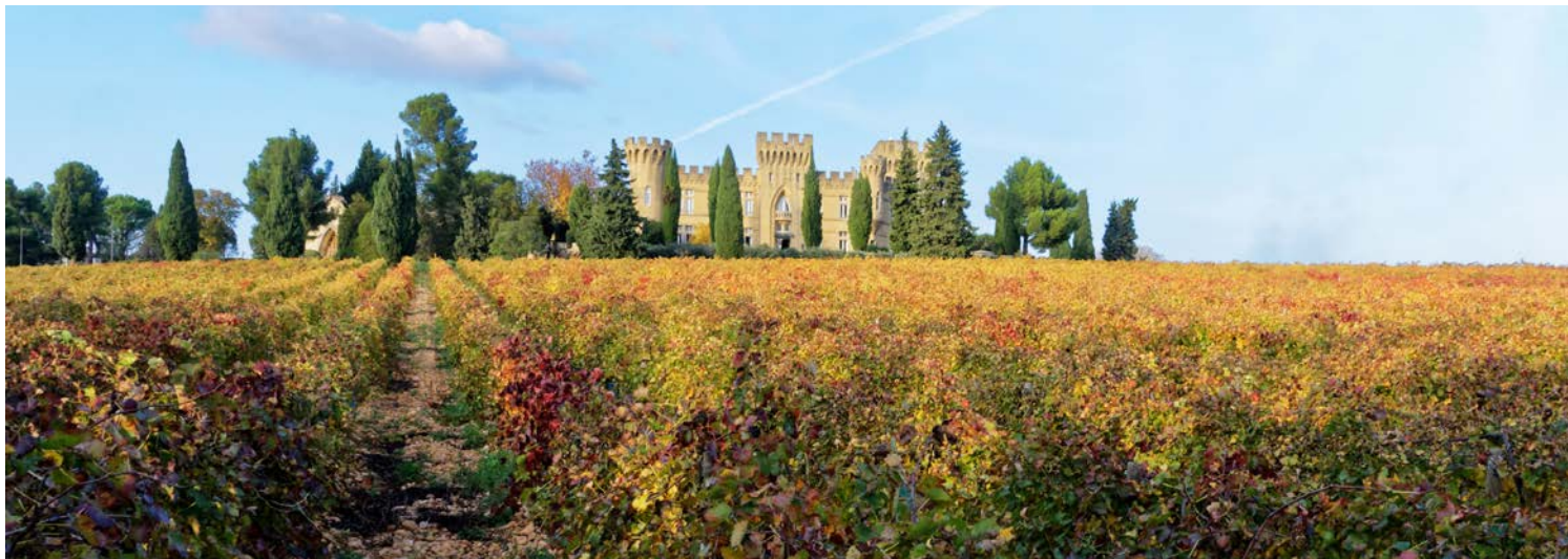
Weinregion um Châteauneuf-du-Pape