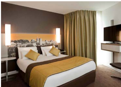
Beispiel – Hotelzimmer

Das Hotel Mercure Cité des Papes (Landeskategorie: 4 Sterne) liegt in unmittelbarer Nähe zum Place de l'Horloge, direkt am berühmten Papstpalast. Aufgrund der optimalen Lage sind zahlreiche Sehenswürdigkeiten schnell zu erreichen. Cafés, Restaurants und viele kleine Geschäfte befinden sich in der Nähe. Alle 73 Zimmer sind komfortabel mit Bad/WC, Fernseher, Telefon und Minibar ausgestattet. Die Zimmer der Kategorie Classic sind etwa 15qm groß und verfügen über ein Doppelbett (160x 200 cm) oder zwei Betten (jew. 100 x 200 cm). Zimmer der Superiorkategorie sind ca. 21 qm groß und verfügen zusätzlich über ein Einzel-Schlafsofa (auf Anfrage gegen Aufpreis möglich).