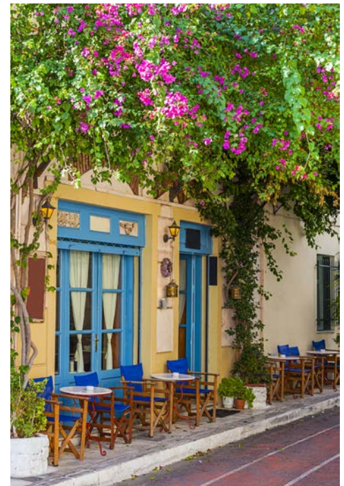
In der Plaka (Altstadt) von Athen

Heute geht es in die Landeshauptstadt. Sie beginnen zunächst mit einer Stadtrundfahrt in Athen. Vorbei am Zeustempel, dem königlichen Palast, dem Parlament und dem Sindagma-Platz fahren Sie zur Akropolis, von wo Sie einen wunderbaren Blick über Athen haben. Freizeit mit Gelegenheit zum Mittagessen in der Plaka. Anschließend Spaziergang durch