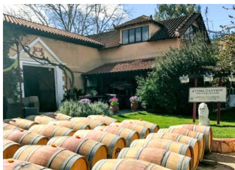
Sie besuchen auch ein Weingut

lokale Spezialitäten während der Mittagspause zu probieren (nicht inkludiert). Anschließend geht es am Nachmittag zum Kloster Mega Spilio. Es liegt in der einsamen Berglandschaft oberhalb des tief eingeschnittenen Vouraikos-Tales und „klebt“ förmlich an einer schroffen Felswand. Das bis zu acht Stockwerke hohe Kloster wurde im Jahre 840 gegründet und gilt noch heute bei vielen Griechen als beliebtes Ausflugsziel. Anschließend Rückfahrt zum Hotel (ca. 200 km).