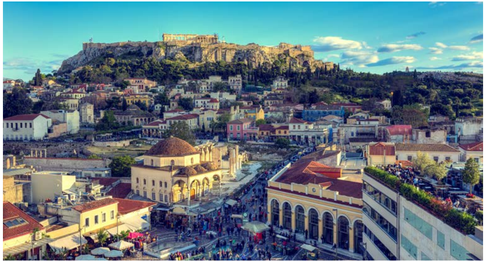
Die Akropolis thront oberhalb von Athen

Peloponnes umfasst den südlichen Teil der griechischen Balkanhalbinsel und ragt im Vergleich zu den anderen Landesteilen am weitesten ins Mittelmeer. Der Name wird von der mythologischen Figur des Pelops hergeleitet, welcher ein Sohn des Tantalos war. Die Endung des Namens beschreibt die griechische Bezeichnung für Insel. Das Territorium wird im Osten von der Ägäis und im Westen vom Ionischen Meer begrenzt. Der Peloponnes ist bei Korinth über eine schmale Landenge von fast 6 km Breite zu erreichen. Trotzdem ist der Peloponnes keine Insel im klassischen Sinne, da ein im Jahre 1893 von Menschenhand erbauter Kanal das Festland von der Halbinsel trennt. Die Region gehört zweifelsohne zu den schönsten und abwechslungsreichsten Landschaften Griechenlands: lange, mit Dünen gesäumte Sandstrände an der Westküste, wuchtig aufragende Gebirgszüge, berühmte Ausgrabungsstätten wie Epidaurus und Mykene, römische Thermen, antike Museen, oder Klöster mit kunstvollen Fresken erwarten Sie.