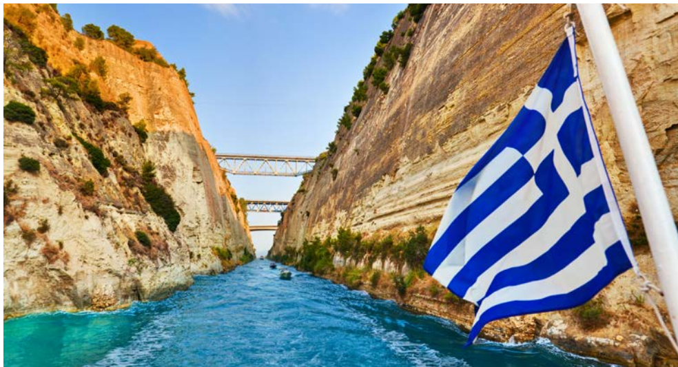
Blick über den Kanal von Korinth