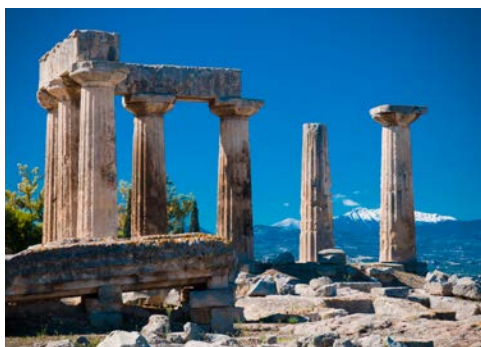
Ausgrabungen in Alt Korinth

Wenn Sie mögen, fahren Sie heute im Rahmen des zusätzlich buchbaren Ausflugs über die Küstenautobahn in westlicher Richtung nach Diakopto. Von hier aus fahren Sie mit der Zahnradbahn hinauf nach Kalavryta, in einen der bedeutendsten Wintersportorte Griechenlands. Die landschaftlich sehr beeindruckende Bahnstrecke wurde zwischen 1889 und 1896 gebaut und verläuft teilweise in der Felswand der Vouraikossschlucht. Sie hat eine Länge von 22 Kilometern und die Fahrt dauert etwa eine Stunde. Im romantischen Ort Kalavryta haben Sie Gelegenheit in einer der traditionellen Tavernen einige