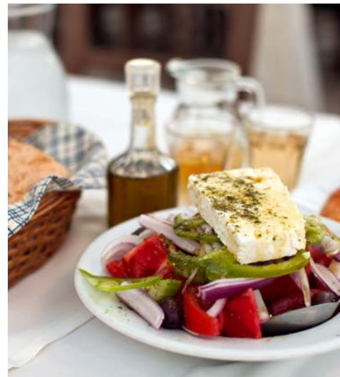
Kaliki Orexi (Guten Appetit)

Heiligtum an den grünen Berghängen des Parnasos und bietet traumhafte Ausblicke in die hügelige Ebene mit seinen Olivenplantagen, die bis ans Meer hin reichen. Ein Rundgang durch die alten Ruinen und Tempelanlagen lässt noch heute den Besucher die Magie der alten Orakelstätte spüren. Nach einer Pause mit Gelegenheit zum Mittagessen in der Ortschaft Delphi geht es wieder zurück zum Hotel (ca. 530 km).