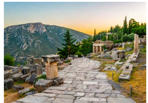
Orakel von Delphi

Heute besichtigen Sie Delphi, den „Nabel“ der antiken Welt, eine der wohl bedeutendsten Ausgrabungen Europas. Terrassenförmig eingefügt liegt das antike