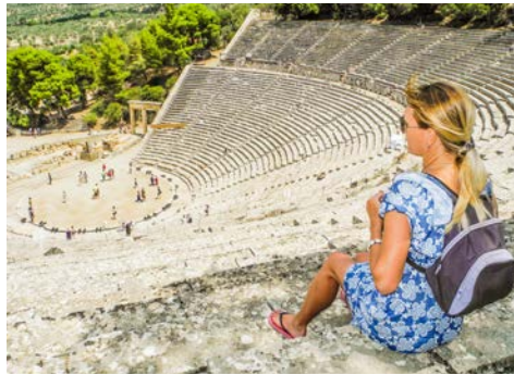
Amphitheater in Epidaurus

Nach der Ankunft am Flughafen von Athen erfolgt der Transfer zum Hotel bei Vrachati (ca. 130 km).