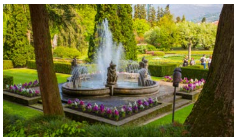
Botanischer Garten der Villa Taranto

Wenn Sie mögen, entdecken Sie einen typisch italienischen Markt in Cannobio (Reisetage vom 6. bis 11.04.) oder in Omegna (Reisetage vom 30.04. bis 5.05.) am westlichen Ufer des Lago Maggiore. Freuen Sie sich auf Händler, die heimische Spezialitäten wie Wurst, Käse, Fleisch oder Fisch, aber auch Kleider und Schmuck feilbieten. Nach dem Besuch des Marktes fahren Sie mit dem Bus nach Verbania. Dort besuchen Sie den herrlichen Botanischen Garten Villa Taranto, der nach dem Vorbild eines englischen Gartens von dem schottischen Kapitän Neil Mc Eacharn errichtet wurde. Mehr als 20.000 Pflanzen, teilweise sehr seltene Blumenarten, sind auf einem 20 Hektar großen Parkgelände zu sehen. Farbenfrohe Azaleen, Ahorne, Seerosen, Rhododendren und Kamelien sowie über 300 verschiedene Dahlienarten können u.a. bewundert werden. Ein Besuch des botanischen Gartens ist wie eine Reise in ferne Länder und deren unendliche Schönheit der Natur.