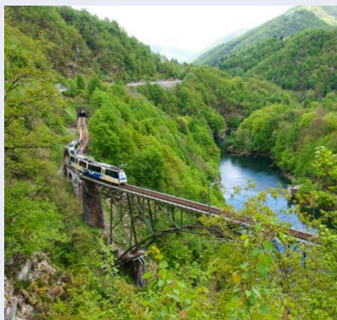
„Centovalli“ bedeutet hundert Täler

Es erwartet Sie ein ganz besonderer Ausflug: Eine Reise durch Nostalgie und Romantik, entlang tiefer Schluchten und Felsspalten mit glänzenden Wasserfällen, über bunte Wiesen und gewagte Brücken, durch Rebgele und Kastanienwälder. Mit der berühmten „Centovalli-Bahn“ fahren Sie, auf einer gut zweieinhalbstündigen Fahrt, zwischen Domodossola und Locarno durch das Valle Vigèzzo und dann durch die malerischen „hundert Täler“, welche der Bahn ihren Namen gaben. Ihre Mittagspause verbringen Sie im schweizerischen Lugano, Tessins größter Stadt. Eine Schiffsfahrt über den Lago di Lugano rundet das Programm ab.