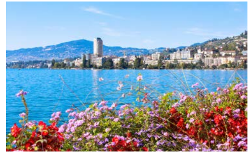
Blick auf Montreux