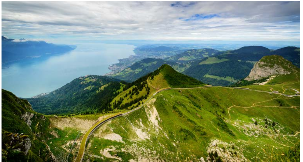
Rochers de Naye mit Blick auf den Genfer See

Gstaad lernen Sie bei einem geführten Ortsrundgang kennen. Zurück nach Montreux geht es wieder mit dem Zug. Genießen Sie noch einmal den prachtvollen Ausblick auf die spektakuläre Landschaft.