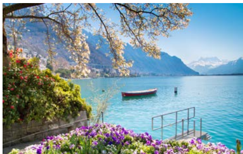
Frühling am Genfer See

Nach dem Frühstück erfolgt die Rückreise im 1. Klasse-Sonderzug AKE-RHEINGOLD zu Ihrem Heimatbahnhof.