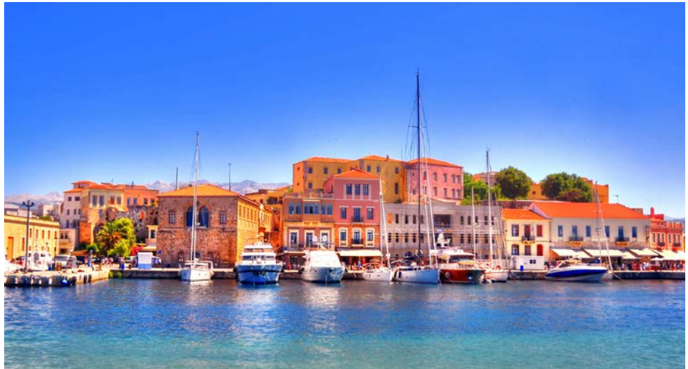
In der Bucht von Chania

so intensiv blau leuchtet das Meer rund um Kreta, dass sich das Herz des Besuchers vor Sehnsucht zusammenzieht. Auf der größten griechischen Insel ist viel Platz für kilometerlange Sandstrände an der Nordküste und für malerische Buchten zwischen steilen Klippen im Süden. Dazwischen erheben sich über 2.000 m hohe Berge mit wildromantischen Schluchten und fruchtbarem Hügelland. In dieser großzügigen Natur entwickelte sich vor 4.000 Jahren die erste europäische Hochkultur: Das minoische Reich beeindruckt selbst als Ruine wie dem monumentalen Palast von Knossos. Entsprechend stolz ist der Kreter auf seine Vorfahren und auf seine Heimat, deren Schönheiten er gerne den Besuchern zeigt. Eine der landschaftlich schönsten Inseln im Mittelmeer erwartet Sie!