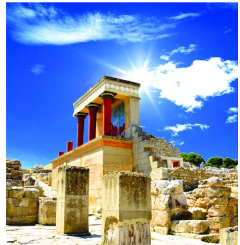
Knossos wird Sie faszinieren

Nach dem Frühstück fahren Sie zur Lassithi-Hochebene, der größten Hochebene Kretas. Die Fahrt geht über das Dorf Mochlos zum 1841 erbauten Kloster Vidiani. Dort befindet sich ein kleines naturhistorisches Museum. Anschließend geht es weiter zum größten Dorf der Hochebene in Richtung Plateau von Lassithi. Außerdem besichtigen Sie auf diesem Ausflug die Dikteon-Höhle, die nach griechischer Mythologie die Geburtsstätte des Zeus, dem bedeutendsten aller antiken Götter, gewesen ist. Der Mythologie nach brachte Rhea Zeus heimlich in dieser Höhle zur Welt, um ihn vor seinem Vater Kronos zu schützen, der bislang all seine Kinder lebend verschluckte.