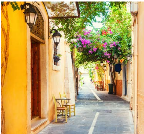
Schmale Gasse in Rethymnon

Genießen Sie diesen Tag auf eigene Faust, erholen Sie sich am Strand oder in der Hotelanlage.