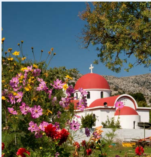
Kloster Vidiani in der Lassithi Hochebene

Erstes Ziel dieser abwechslungsreichen Fahrt ist das Kloster Arkadi. Es wurde während der Aufstände gegen die türkische Herrschaft zum Symbol des kretischen Freiheitskampfes und ist heute kretisches Nationalheiligtum. Nach kurzer Fahrt erreichen Sie Rethymnon. Lassen Sie sich bezaubern vom ganz besonderen Flair der vollständig erhaltenen Altstadt mit Gebäuden aus venezianischer und türkischer Zeit. Entlang der