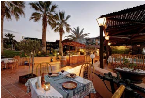
Terrasse des Hotels