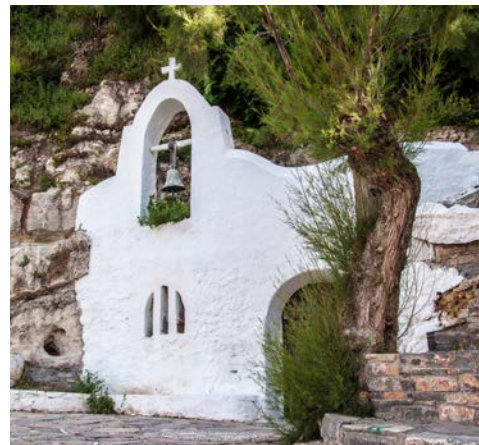
Kleine Kapelle in Agios Nikolaos

Die kleine Insel liegt in der schönen Bucht von Mirabello. Einst war die Insel ein Seeräuberstützpunkt, Ende des 16. Jahrhunderts venezianische Festung, dann eine türkische Siedlung, bevor sie 1903 zur Leprakolonie ernannt wurde. Nach der Entdeckung des Impferums wurde im Jahr 1955 die Isolation aufgehoben. Die letzten Bewohner haben die Insel 1957 verlassen. Mit kleinen Fischerbooten geht es zu der kurzen Überfahrt nach Spinalonga. Während der Führung über diese sehenswerte Insel erhalten Sie interessante Informationen über ihre Geschichte. Sie haben die Möglichkeit, viele Gebäude sowie das große venezianische Fort zu besichtigen. (Eintritt ca. 8 € p.P., vor Ort zahlbar) Von hier aus haben Sie einen herrlichen Blick auf Plaka und Elounda. Im Anschluss können Sie direkt vom Fischerboot aus das kristallklare Nass genießen und ein erfrischendes Bad nehmen. Gelegenheit zur Mittagspause haben Sie in Elounda. Nach dem Bootsausflug besuchen Sie Agios Nikolaos und Sie haben Gelegenheit zu einem Bummel in der kleinen Hafenstadt mit seinem kleinen Süßwasser See. Der Nachmittag klingt mit einem Besuch einer Olivenölfabrik in Neapoli aus.