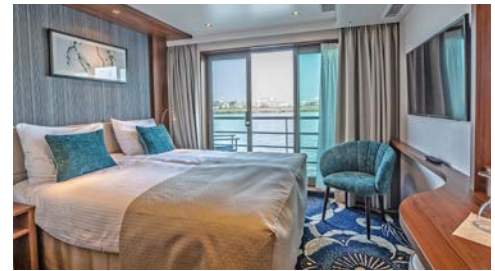
Komfortable Kabinen, z.B. auf dem Diamantdeck

Programmänderungen vorbehalten. An- und Abreisetage dienen ausschließlich der Erbringung der vertraglichen Beförderungsleistungen. Stand 03/21 – alle Angaben ohne Gewähr.