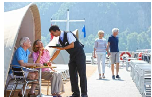
Herzlicher Service ...

Weitere buchungsrelevante Informationen zu dieser Reise (An- und Abreise, Gesundheitshinweise, Barrierefreiheit, eventuell anfallende Mehrkosten während der Reise etc.) erhalten Sie im Internet unter: www.bnn.de/leserreisen