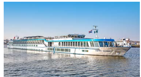
... an Bord der SWISS CROWN