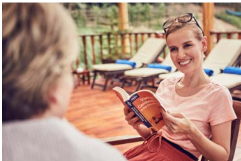
Auszeit an Bord