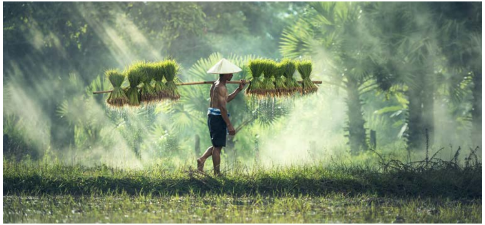
Ganz traditionell – ein Reisfarmer in Laos