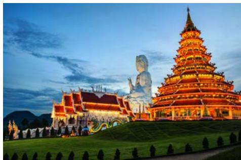
Chiang Rai – Wat Huai Pla Kung Temple

Nach dem Frühstück fahren Sie in die berühmteste Region des Goldenen Dreiecks. Sie überblicken zusammen mit dem Goldenen Buddha am Fuße des Tempelbergs die Grenzregion zwischen Thailand, Myanmar und Laos und besuchen die Hall of Opium, die die Geschichte des heute verbotenen Opium-Anbaus erzählt. Am Abend heißt Sie die Crew an Bord Ihres Flusskreuzfahrtschiffs Mekong Pearl herzlich willkommen. Sie beziehen Ihr komfortables schwimmendes Zuhause für die kommenden zehn Nächte. (F/M/A)