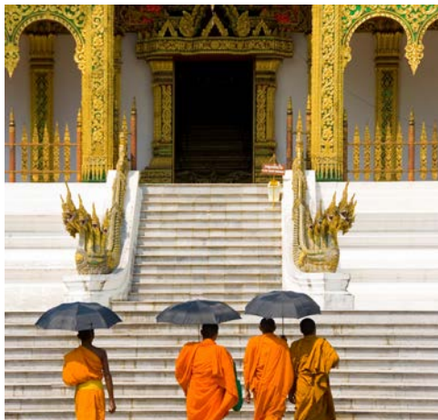
Alte Tempel und Mönchsrituale in Luang Prabang

feilgeboten wird. Achtung, der Besuch ist nur etwas für starke Mägen! Der restliche Tag steht Ihnen für eigene Streifzüge zur Verfügung. Erkunden Sie die Gegend zu Fuß oder mit dem Miet-Fahrrad. Sie können auch einen Einkaufsbummel unternehmen, das Flair der Stadt in einem der zahlreichen Cafés aufsaugen oder einen Ausflug in die Umgebung machen. Anschließend nehmen Sie an einer traditionellen laotischen Baci-Freundschafts-Zeremonie teil, untermauert mit klassisch laotischer Musik und Tanz. (F/A)