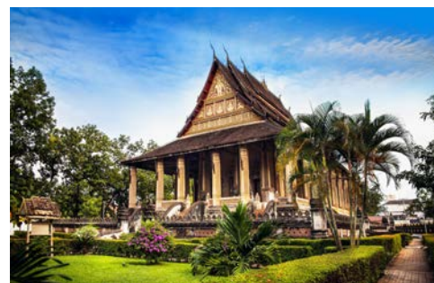
Ho Phra Keo -Tempel - Vientiane