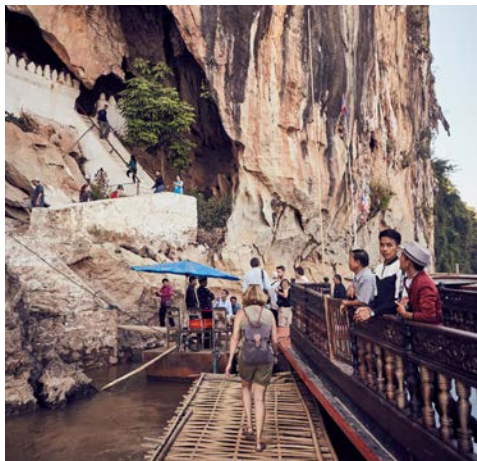
Die Pak-Ou Höhlen

Lehnen Sie sich zurück und genießen Sie bequem vom Sonnendeck oder von Ihrer Kabine aus die eindrucksvollen Flusspanoramen am Mekong. Bei gutem Wetter können Sie heute wieder eine kurze Wanderung zu noch weitgehend unentdeckten Höhlen unternehmen. In Ihrer Freizeit können Sie auf dem Sonnendeck entspannen oder den kurzweiligen Bordvorträgen lauschen. Auf unterhaltsame Weise erfahren Sie auch Details zur Geschichte von Laos und seiner Bevölkerung. Vielleicht möchten Sie ja auch an einer Obstverkostung an Bord teilnehmen? (F/M/A)