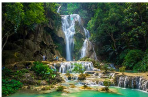
Die Wasserfälle von Kuang Si

Heute besuchen Sie einen bei den Einheimischen sehr beliebten Park mit den malerischen Kuang Si-Wasserfällen. Die türkisblauen Pools zwischen den einzelnen Kaskaden inmitten der üppig-grünen Vegetation laden vor allem an heißen Tagen zu einem erfrischenden Bad ein. Ihr Schiff schlängelt sich dann weiter südwärts. Sie passieren per Schleuse eines der größten Bauprojekte in Laos, den imposanten Staudamm bei Xayaburi. In Laos ankert Ihr Flusskreuzfahrtschiff an einer Sandbank oder am Ufer, wo Sie Ihr Abendessen an Bord inmitten ursprünglicher Natur genießen. (F/M/A)