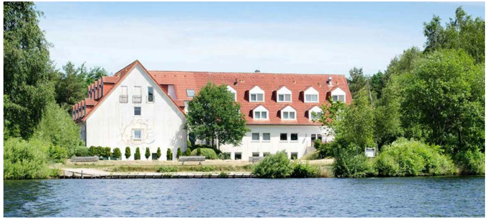
Ihr Hotel am See