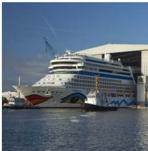
Die Meyer Werft in Papenburg

Aber auch als Schutz vor Sturmfluten und Hochwasser erfüllt das Sperrwerk eine wichtige Rolle, um sich vor den ständig steigenden und fallenden Wasserständen der Nordsee zu schützen. Um die Marschlandschaften urbar und bewohnbar zu machen, wurden an der Küste seit je her vielerorts Sperrwerke – sogenannte Siele – errichtet. So mancher Ort der Region trägt daher diesen Begriff im Namen. Sie sehen heute gleich drei davon: Greetsiel ein wirklich idyllischen Fischerort, in dem sich ein Spaziergang am Hafenbecken anbietet. Auch Bensorsiel und Neuharlingersiel passieren Sie heute.