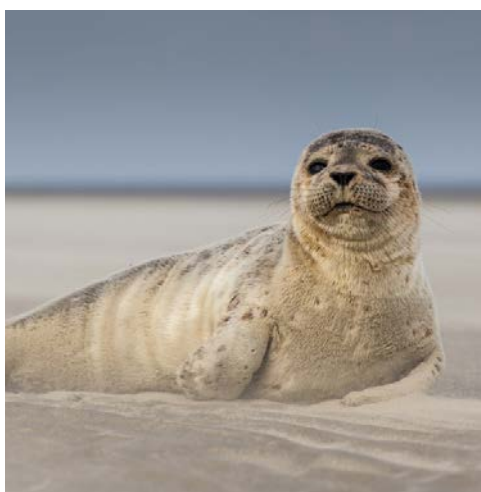
Ein Ureinwohner an der Nordseeküste

vorbereitet. Hier lernen Sie viel Wissenswertes über Kegelrobben und Seehunde. „Welche Stadt hat nur einen Buchstaben? „M“, lautet ein ostfriesischer Scherz. Die wichtigsten Sehenswürdigkeiten der Stadt Emden, deren meisten Buchstaben die Ostfriesen so gerne verschlucken, sehen Sie bei einer Rundfahrt auf dem Weg zurück zum Hotel. Am Abend begehen Sie dort dann die Silvesterfeier. Bei einem abwechslungsreichen Abendprogramm genießen Sie die exklusiv zusammengestellten Speisen und Köstlichkeiten. Freuen Sie sich auf das wundervolle Feuerwerk, dass sich gut von der großen Außenterrasse am Ottermeer beobachten lässt, und verkürzen Sie sich die Zeit bis dahin mit Musik und Tanz. Guten Rutsch!