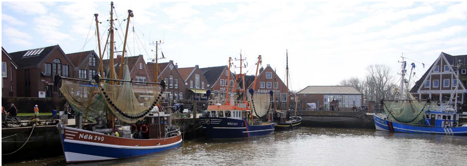
Traditionelle Kutter im Hafen von Neuharlingersiel