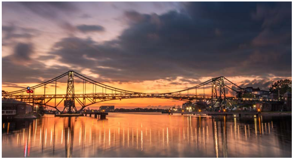
Große Drehbrücke aus der Kaiserzeit in Wilhelmshaven.