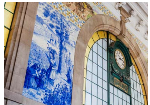
Im Bahnhof São Bento

Am Vormittag offenbart sich Ihnen warum Porto den Zusatz Barockstadt trägt. Dies liegt zum einen an den zahlreichen barocken Kirchen. Hervorzuheben ist der 75m hohe Kirchturm Torre dos Clerigos. Wer möchte, erklimmt im Anschluss an den geführten Stadtsparziergang den Turm und genießt von der Aussichtsplattform den grandiosen Rundblick. Zuvor müssen 240 Stufen geschafft werden. Bei dem Rundgang bieten sich Ihnen zahlreiche Eindrücke der Stadt, in der sich entspanntes südländisches Flair mit der allgegenwärtigen Authentizität einer langen Geschichte mischt. Das zeigt sich allein schon an vielen kleinen