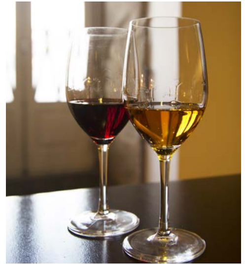
Portwein – weiß oder rot