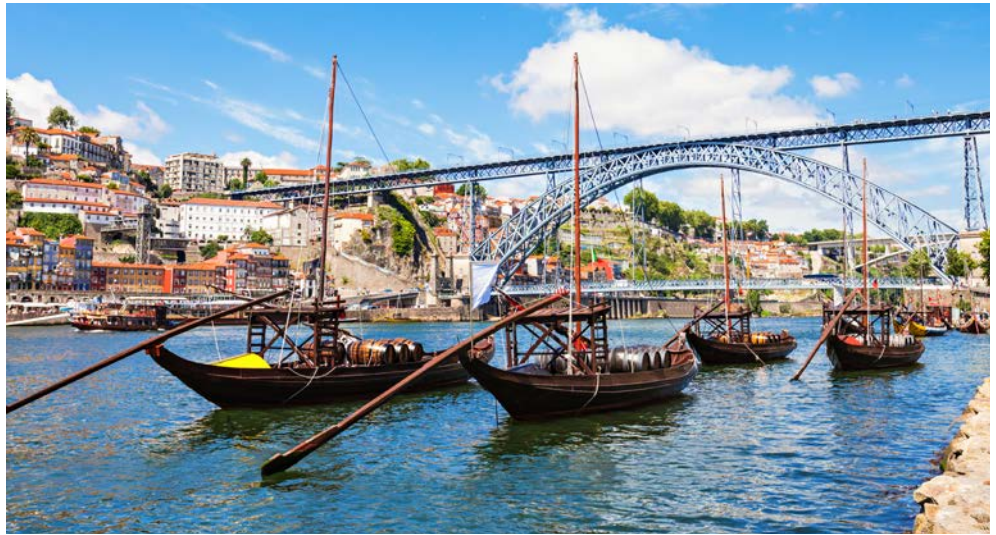
Die Brücke Ponte Luis I mit den typischen Douro-Schiffen

Ein Besuch in Porto gilt noch als Geheimtipp, denn aufgrund seiner Lage am Rande Europas, geht es hier noch gelassener und gemächlicher zu. Das Wort Saudade ist der portugiesische Inbegriff für ein Gefühl aus Sehnsucht, Melancholie und Einsamkeit. Lassen Sie sich in den Bann ziehen von der Gastfreundschaft und der portugiesischen Lebensart.