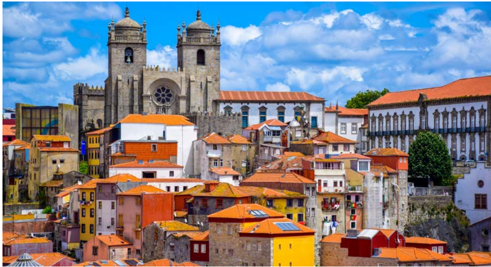
Aussicht auf Ribeira – die Altstadt von Porto