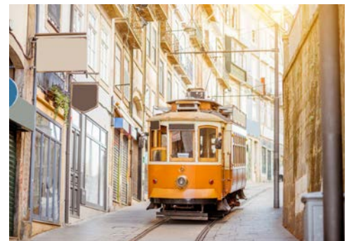
Die Straßenbahn in der Altstadt

Der Nachmittag steht Ihnen für eigene Erkundungen zur freien Verfügung. Eventuell unternehmen Sie eine Fahrt mit der Straßenbahn, entlang des Douro, bis zum Straßenbahnmuseum Carro Eléctrico, das bereits 1922 eingeweiht wurde.