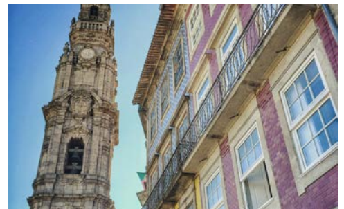
Der 75m hohe Kirchturm Torre dos Clerigos