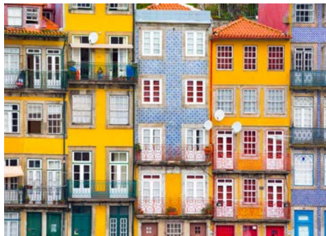
Traditionelle historische Fassade mit den typischen Azulejos

Mit dem Flug nach Porto, wo gegen Mittag die Landung erfolgt, startet diese einzigartige Kulturreise. Und gleich im Anschluss, auf Ihrer Fahrt zum Hotel, lässt sich bereits die Fülle an Sehenswürdigkeiten der Barockstadt erleben. Auf einer etwa dreistündigen orientierenden Stadtrundfahrt, die an Ihrem Hotel endet, erhalten Sie einen ersten guten Überblick. Nach dem Zimmerbezug im zentral gelegenen Hotel, unternehmen Sie am späten Nachmittag einen ersten orientierenden Spaziergang. Die erste Visite endet mit einem gemeinsamen Abendessen in der bezaubernden Stadt.