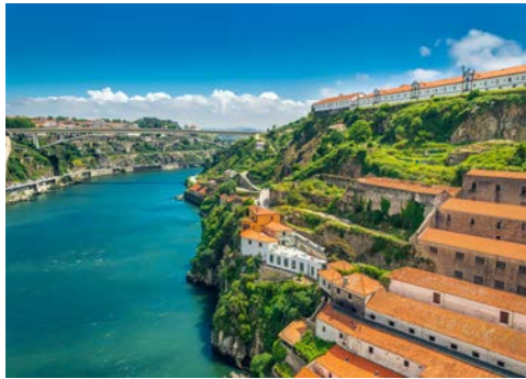
Hügel von Vila Nova de Gaia

Der Vormittag steht Ihnen zur freien Verfügung. Porto hat noch vieles zu entdecken. So zum Beispiel die alte Buchhandlung Lello, die als eine der schönsten Europas gilt. Von außen fasziniert die neogotische Fassade, innen das geschwungene Treppenhaus und natürlich das enorme Büchersortiment. Für eine entspannte Pause empfiehlt sich das legendäre Café Majestic in der Einkaufsstraße Rua de Santa Catarina. Im Stil der französischen Belle Époque, mit Kronleuchtern und dem Jugendstil-Spiegelsaal eingerichtet, fasziniert die Kaffeehauskultur jeden Besucher.