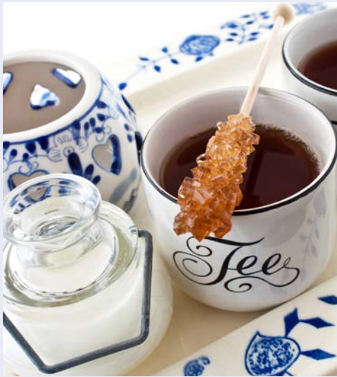
Genießen Sie den berühmten ostfriesischen Tee

Im äußersten Nordwesten Deutschlands, wo sich das Wasser in kleinen Kanälen ohne große Eile seinen Weg durch flaches Marschland bahnt, wo erfrischende Brisen die Flügel alter Windmühlen behutsam in Bewegung setzen und manchmal einzig das Geschrei frecher Möwen die idyllische Ruhe stört, scheinen die Uhren ein wenig langsamer zu ticken als andernorts. Fernab des Alltags daheim erwartet Sie in Ostfriesland daher ein wunderbar erholsamer Jahreswechsel. Vor und nach der Silvesterfeier bleibt genügend Zeit, die einzigartige Region zu erkunden. Dabei besuchen Sie etwa die Seehafenstadt Emden und das pittoreske Fischerdorf Greetsiel. Weitere Ausflüge führen zur Insel Langeoog mit Bimmelbahnfahrt, zur Seehundaufzuchtstation Norddeich in der Stadt Norden und nach Leer – dem „Tor Ostfrieslands“. Ein echtes Kulturgut Ostfrieslands ist übrigens der Tee. Bei einer typischen Teezeremonie lässt sich Interessantes über das Heißgetränk erfahren, etwa, wie die Ostfriesen seit Jahrhunderten ihr selbst ernanntes Nationalgetränk verteidigen. Und schließlich wird einer der wichtigsten Arbeitgeber der Region besucht: die Meyer Werft in Papenburg, die seit sechs Generationen ihre imposanten Ozeanriesen und eleganten Flussschiffe durch die Ems ins Meer schickt. Tauchen Sie mit einem gemütlichen „Moin!“ ein in eine Region, die zu Recht als schönstes Urlaubsparadies im Norden gilt.