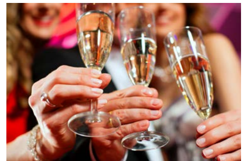
Freuen Sie sich auf die Silvesterfeier

die Produktionsstätte so mancher hochmoderner Kreuzfahrtschiffe ist. Überzeugen Sie sich vor Ort von den schier überwältigen Dimensionen des überdachten Trockendocks und dem Wendebassin und lassen Sie sich in einem großen Ausstellungsbereich vom technisch anspruchsvollen und innovativen Schiffsbau – made in Germany – begeistern. Nach der eigenständigen Besichtigung führt Sie ihr Weg nach Leer. Aufgrund der Lage im ostfriesischen Süden ist Leer auch als „Tor Ostfrieslands“ bekannt. In der schönen Altstadt sind das historische Rathaus, das Heimatmuseum und die Waage zu finden, die sich bei einem Bummel durch die Straßen erkunden lassen. Das Haus „Samson“ gehört zu den schönsten Bauwerken der Stadt und beherbergt heute eine Sammlung ostfriesischer Wohnkultur. Anschließend Rückfahrt zum Hotel.