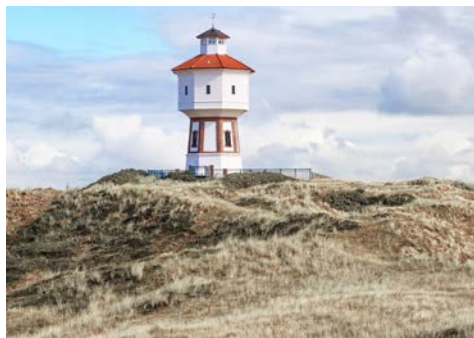
Langeoog – zu jeder Jahreszeit ein Inseltraum.

Heute geht es per Bus, Schiff und Bimmelbahn nach Langeoog, der drittgrößten Ostfriesischen Insel. Die Insel hat eine Fläche von ca. 20 Quadratkilometern mit einem atemberaubenden 14 Kilometer langen Sandstrand. Langeoog bedeutet aus dem friesischen denn auch „Lange Insel“. Sie liegt zwischen den beiden Inseln Baltrum und Spiekeroog im Unesco-Welt-naturerbe Wattenmeer. Autolärm und Abgase sind hier nicht vorhanden. Langeoog ist autofrei! Stattdessen kann man auf Spaziergängen, Wanderungen und Radtouren die Natur in vollen Zügen genießen. Für Erholungssuchende bietet die Nordseeinsel weite und teils unberührte Natur, mit umliegenden Salzwiesen, wunderschönen Dünenlandschaften. Anschließend geht es mit der kleinen Inselbahn wieder zurück zum Hafen, auf die Fähre und weiter per Bus zum Hotel.