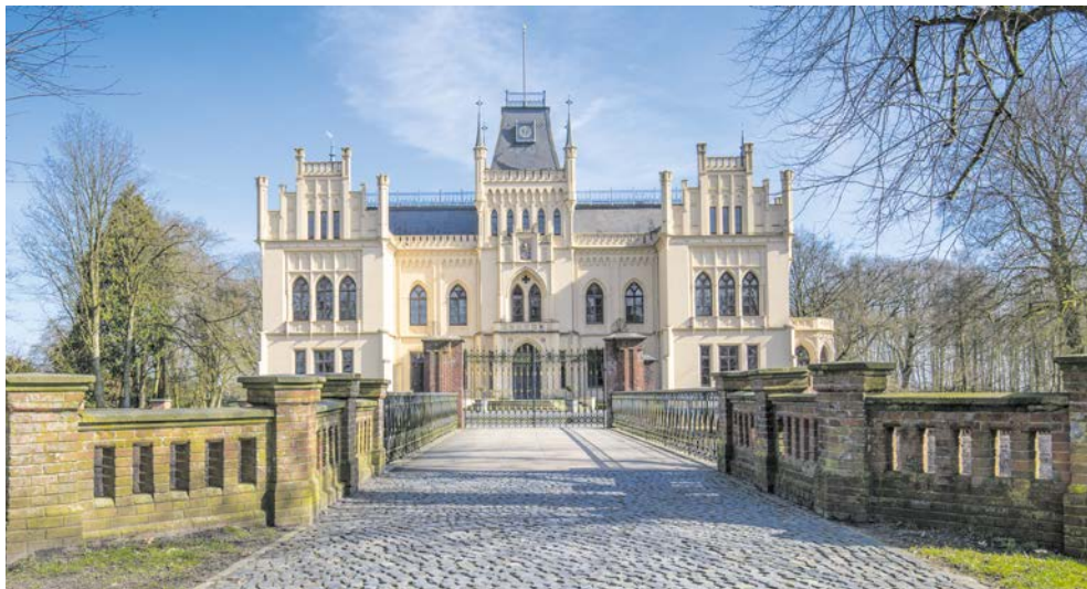
Schloss Evenburg in Leer