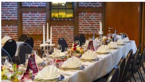
Gasthof Tepe – hier feiern Sie ins neue Jahr!

Im hoteleigenen Restaurant werden Ihnen jeden Morgen ein Frühstücksbuffet und zum Mittag- und Abendessen regionale und internationale Gerichte angeboten. Trainieren Sie im gut ausgestatteten Fitnesscenter und entspannen Sie sich danach in der Sauna, im Dampfbad oder in den Whirlpools.