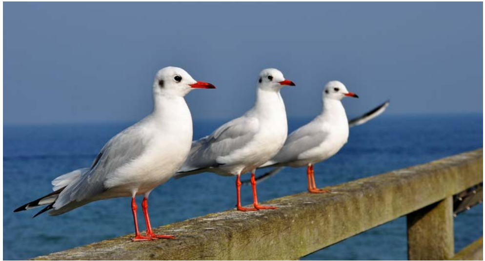
Herzlich willkommen an der See