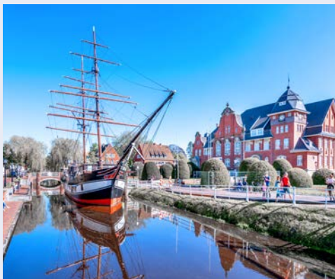
Willkommen in Papenburg

Im äußersten Nordwesten Deutschlands, wo sich das Wasser in kleinen Kanälen ohne große Eile seinen Weg durch flaches Marschland bahnt, wo erfrischende Brisen die Flügel alter Windmühlen behutsam in Bewegung setzen und manchmal einzig das Geschrei frecher Möwen die idyllische Ruhe stört, scheinen die Uhren ein wenig langsamer zu ticken als andernorts. Fernab des Alltags daheim erwartet Sie in Ostfriesland daher ein wunderbar erholsamer Jahreswechsel. Vor und nach der Silvesterfeier bleibt genügend Zeit, die einzigartige Region zu erkunden. Dabei besuchen Sie etwa die Seehafenstadt Emden und das pittoreske Fischerdorf Greetsiel. Weitere Ausflüge führen zur Insel Langeoog mit Bimmelbahnfahrt, zur Seehundaufzuchtstation Norddeich in der Stadt Norden und nach Leer – dem „Tor Ostfrieslands“. Ein echtes Kulturgut Ostfrieslands ist übrigens der Tee. Bei einer typischen Teezeremonie lässt sich Interessantes über das Heißgetränk erfahren, etwa, wie die Ostfriesen seit Jahrhunderten ihr selbst ernanntes Nationalgetränk verteidigen. Und schließlich wird einer der wichtigsten Arbeitgeber der Region besucht: die Meyer Werft in Papenburg, die seit sechs Generationen ihre imposanten Ozeanriesen und eleganten Flussschiffe durch die Ems ins Meer schickt. Tauchen Sie mit einem gemütlichen „Moin!“ ein in eine Region, die zu Recht als schönstes Urlaubsparadies im Norden gilt.