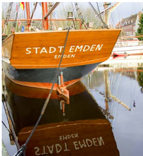
Auch Emden hat einen charmante Hafen

– auch die Sahne und die traditionellen weißen Kluntje. Alles muss dann nacheinander in der richtigen Reihenfolge in eine extra dünne Tasse gefüllt werden. Erst so entfaltet der Ostfriesentee seinen exzellenten Geschmack.