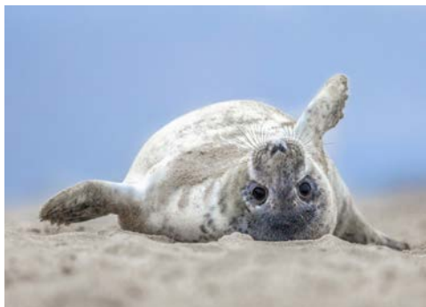
Entdecken Sie die Seehundstation in Norddeich

Frohes Neues! Heute unternehmen Sie nach dem ausgiebigen Neujahrsfrühstück eine Rundfahrt durch