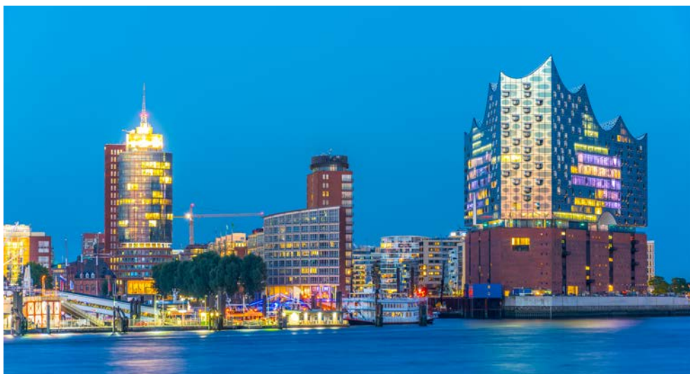
Freuen Sie sich auf Ihr besonderes Konzert in der Elbphilharmonie