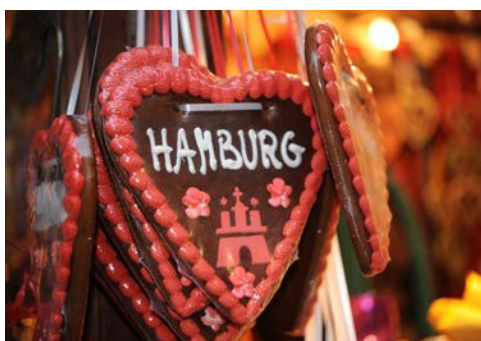
Weihnachtliches aus Hamburg

Liebermann und Max Slevogt zum Impressionismus. Schon zeitgenössische kunstwissenschaftliche Stimmen der Bewegung fassten sie zumindest als europäisches Phänomen auf. Das Museum befindet sich fußläufig zum Hotel, so dass Sie nach der Führung so lange in den Ausstellungen verbleiben können, wie Sie möchten.