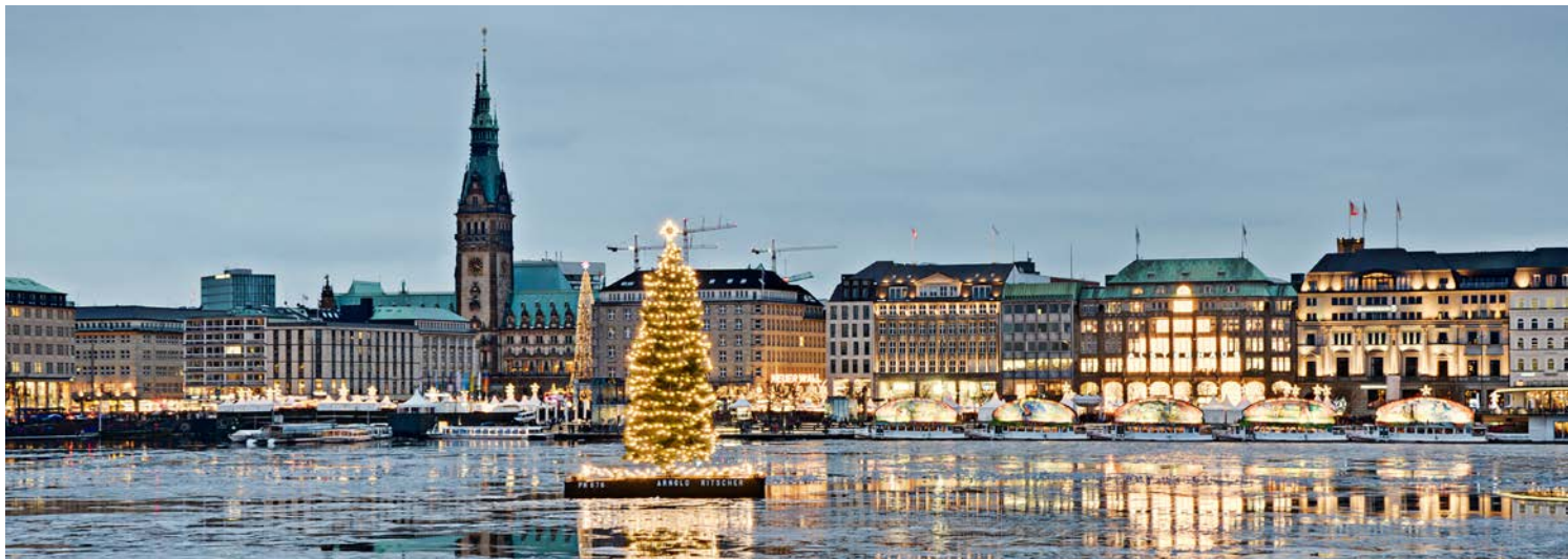
Hamburger Binnenalster zur Weihnachtszeit