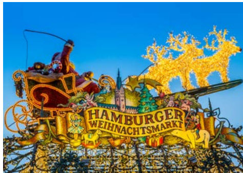
Freuen Sie sich auf die Hamburger Weihnachtsmärkte

Nach Ihrer Anreise in Hamburg beziehen Sie ab 15 Uhr Ihre Zimmer im ehrwürdigen Hotel Reichshof. Um 17 Uhr lernen Sie Ihren Gästeführer kennen, der Sie in den nächsten Tagen begleiten wird und begeben sich gemeinsam auf einen geführten Spaziergang durch den beliebten Hamburger Stadtteil St. Georg mit seinen kleinen individuellen Geschäften und dem Weihnachtsmarkt. Das charmante Viertel rund um die Lange Reihe, die mit Gebäuden aus dem späten 19. Jahrhundert gesäumt ist, ist voller Kontraste, bunt und hip. Genießen Sie den kleinen Rundgang, bevor Sie um 19 Uhr im Hotel zum Abendessen erwartet werden.