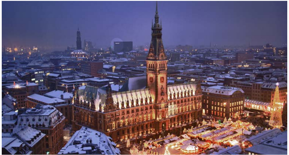
Hamburger Weihnachtsmarkt am Rathaus

Gönnen Sie sich schon vor Weihnachten ein Geschenk und erleben Sie die einzigartige „Missa solemnis“, mit der Ludwig van Beethoven Musikgeschichte schrieb, in der Hamburger Elbphilharmonie. Das Konzerthaus ist innerhalb kürzester Zeit zum neuen Wahrzeichen Hamburgs geworden und ein Konzert im Großen Saal ist ein musikalischer Hochgenuss. Besonders in der Vorweihnachtszeit erstrahlt die geschmückte Hansestadt im Lichterglanz und neben einem winterlichen Rahmenprogramm mit vielen Leckereien bleibt natürlich auch Zeit zum ausgiebigen Weihnachtshopping und Bummeln.