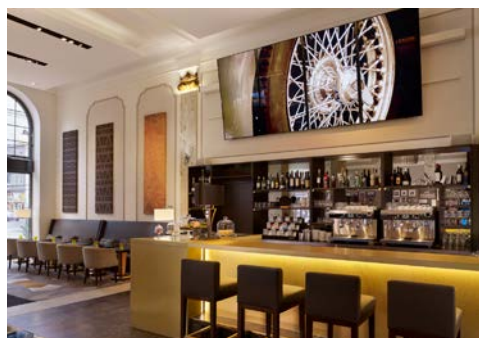
Emil's Bar im Hotel