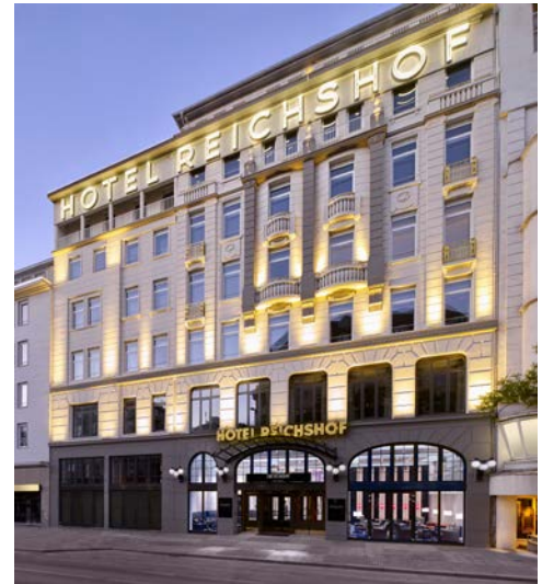
Das Reichshof Hotel Hamburg