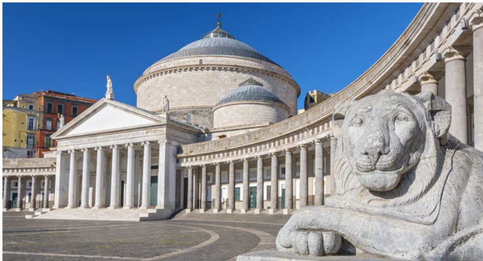
Neapel – Piazza Plebiscito