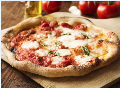
Ein Klassiker – Pizza Napoletana