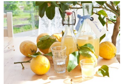
Limoncello – Schon probiert?

Flugplan-, Hotel- und Programmänderungen vorbehalten. An- und Abreisetage dienen ausschließlich der Erbringung der vertraglichen Beförderungsleistungen. Je nach Fluggesellschaft und Flugdauer werden Bordverpflegung und Getränke nur gegen Bezahlung angeboten. Stand 02/20 - alle Angaben ohne Gewähr.