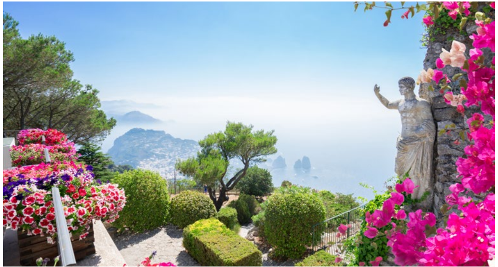
Capri – traumhafte Aussichten von den Augustusgärten