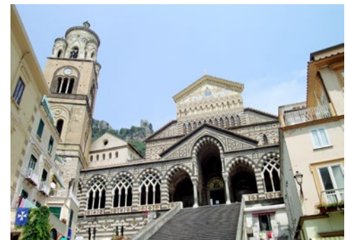
Dom von Amalfi