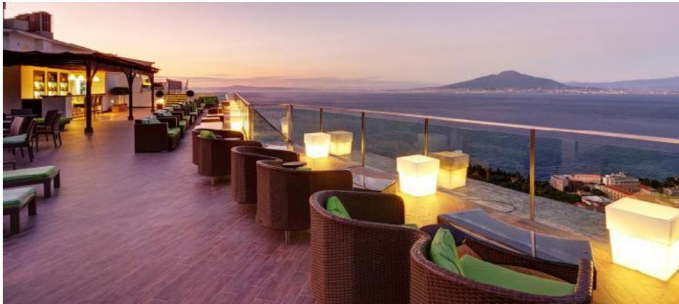
Herrlicher Ausblick von der Dachterrasse