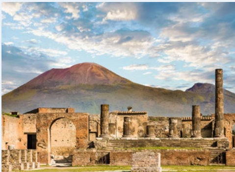
Pompeji und Vesuv – ein Muss für jeden!

seit Jahrhunderten inspiriert die Schönheit des Golfs von Neapel Literaten und Musiker aus ganz Europa. Die einzigartige Kulturlandschaft besticht durch prachtvolle Blütengärten, bizarre Felsformationen und ein azurblaues Meer. Verschlungene Küstenstraßen führen durch Orangen- und Zitronenhaine zu Stätten antiker Geschichte. Kampanische Bauern bewirtschaften ihre Gärten und Höfe in der zerklüfteten Küstenlandschaft seit Generationen. Ob Mozzarella oder Limoncello, hier kommen die Gaben der Natur direkt auf den Tisch. Über all dem thront der Vesuv, sagenhafter Mythos und Ehrfurcht erregende Naturgewalt. Idealer Ausgangspunkt, um diesen reizvollen Landstrich Kampaniens intensiv zu erkunden, ist Sorrent. Ein malerischer Ort, der imposant auf einem Felsplateau liegt. Ganz in der Nähe gründeten die Römer die mondäne antike Stadt Pompeji, deren durch Asche konservierte Architektur die Besucher noch heute in die untergegangene Kultur eintauchen lässt. Spätere Könige, Päpste und Fürsten prägten mit dem Bau gotischer Kirchen und barocker Prachtbauten die Altstadt von Neapel. In kleinen Bergdörfern überdauerten zudem die Bauwerke der Normannen und Mauren die Jahrhunderte. Und auf der wohl schönsten Insel des Tyrrhenischen Meeres, auf Capri, finden sich bis heute Spuren früher Bewunderer der einzigartigen Natur. Hier verbrachten im 19. Jahrhundert sowohl der schwedische Schriftsteller Axel Munthe als auch der deutsche Industrielle Friedrich Alfred Krupp ihre wohl schönsten Lebensjahre.