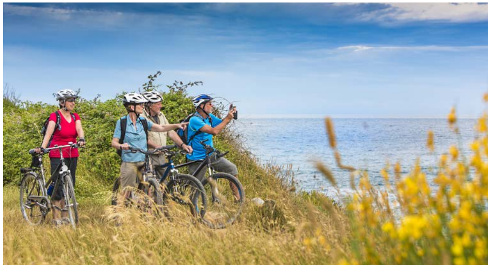
Gemeinsam Kroatien entdecken

Reisen im familiären Kreis mit einer kleinen, aber feinen Yacht – die 16 Kabinen an Bord bieten maximal 32 Reisenden die Gelegenheit, ein großartiges Urlaubserlebnis zu genießen. Auf abwechslungsreichen Fahrradtouren durch die wunderschöne teils hügelige Landschaft mit Ihrem Mountainbike oder an Bord Ihrer exklusiven Yacht MORENA entdecken Sie landschaftliche und kulturelle Perlen an Kroatiens Küste. Nach einem ereignisreichen Tag und einem genussvollen Abendessen entdecken Sie vielleicht den zauberhaften Ort Ihrer Anlegestelle oder tauschen das Erlebte mit Ihren Mitreisenden an Bord aus.