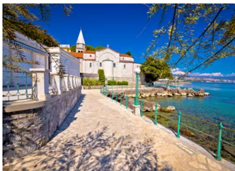
Uferpromenade von Opatija

Nach dem frühen Frühstück erfolgt der Transfer zum Flughafen Triest und Ihre Heimreise wie gebucht.