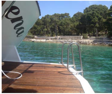
Die Badeplattform der MORENA