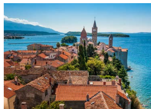
Die schöne Insel Rab

Während des Frühstücks fährt das Schiff nach Lopar auf der Insel Rab – der zweitgrünsten kroatischen Insel. Ihre Radtour führt Sie zu einer berühmten Sandstrandbucht. Dann radeln Sie durch das Innere der Insel, vorbei an der wunderschönen Supetarska Draga in Richtung der alten Stadtmauern von Rab mit ihren vier berühmten Glockentürmen, die sich auf einer pfeilförmigen Landzunge befinden. Nach dem Mittagessen an Bord fahren Sie mit dem Rad in das Naturschutzgebiet „Dundo“ – eines der wenigen Wälder im Mittelmeerraum, das sich über die Halbinsel Kalifront erstreckt. Badepause in der malerischen Bucht heiligen Mara. Abendessen und Übernachtung im Hafen von Rab.