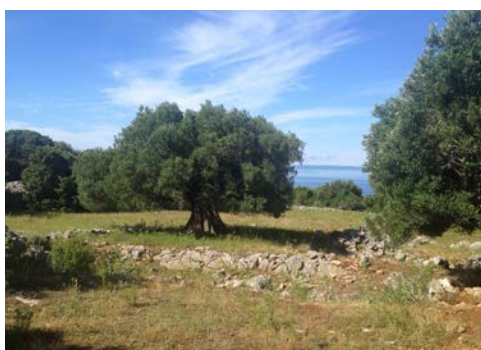
Entlang alter Olivenhaine, das Meer im Blick

Ausblick auf die Stadt und den südlichen Teil des Losinjer Archipels genießen können. Abendessen und Übernachtung im Hafen von Mali Losinj.