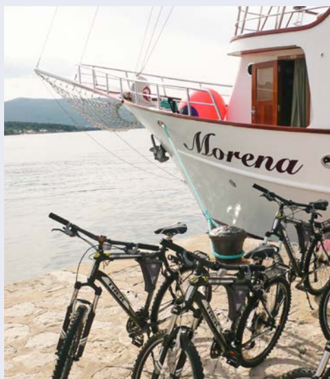
Die Räder stehen für Ihre Radtour bereit