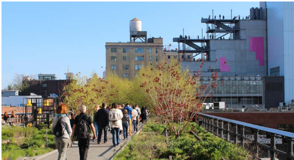
Die „High Line“

kleinen Teil der Sammlung. Eingebettet in eine Park- und Gartenanlage aus dem 19. Jahrhundert, bleibt nach dem Besuch noch Zeit für einen Spaziergang „im Grünen“. Während der anschließenden Rundfahrt dürfen natürlich die berühmten „brownstone houses“ nicht fehlen. Knallbunt und manchmal provokant zeigt sich die internationale Street-Art-Kunstszene des „Brooklyn Collective“. Poppige Kunst und Alltagsszenen sind auf ehemals tristen Industriefassaden und Häuserwänden zu sehen. Es ist schon ein krasser Unterschied, kommt man aus den vornehmen Stadtvierteln Brooklyns. Eine Kaffeepause zwischendurch, lädt dazu ein, über die vielfältigen „Kunstbegegnungen“ ins Gespräch zu kommen.