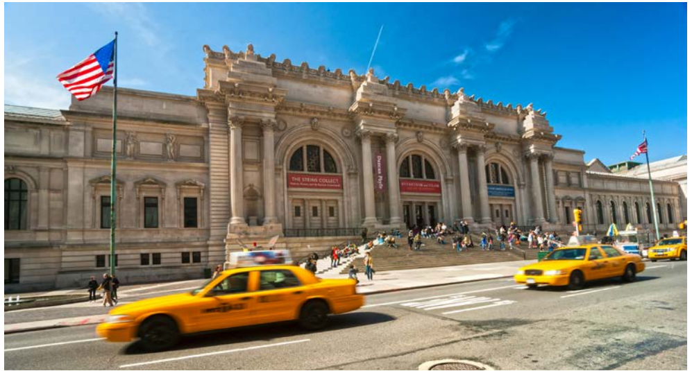
Das Metropolitan Museum of Art

New York gehört zu den bedeutendsten Metropolen der Welt. Doch nicht nur Sehenswürdigkeiten wie der Freiheitsstatue, dem Times Square, der Wall Street und dem Broadway verdankt der „Big Apple“ seine Berühmtheit – es ist vor allem die überaus vielseitige Kunst- und Kulturlandschaft, die seit vielen Jahrzehnten kreative Menschen aus aller Welt in die Stadt lockt. Der Fokus dieser achttägigen Reise liegt deshalb auf den zahlreichen weltbekannten Kunstmuseen und Ausstellungen New Yorks. Neben dem Besuch und den exklusiven Sonderführungen durch das Guggenheim Museum, das Museum of Modern Art und das Metropolitan Museum of Art bleibt auch genügend Zeit, die moderne New Yorker Kunstszene kennenzulernen. Außerdem bietet die Reise auch abseits der bildenden Künste zahlreiche kulturelle und unterhaltsame Highlights.