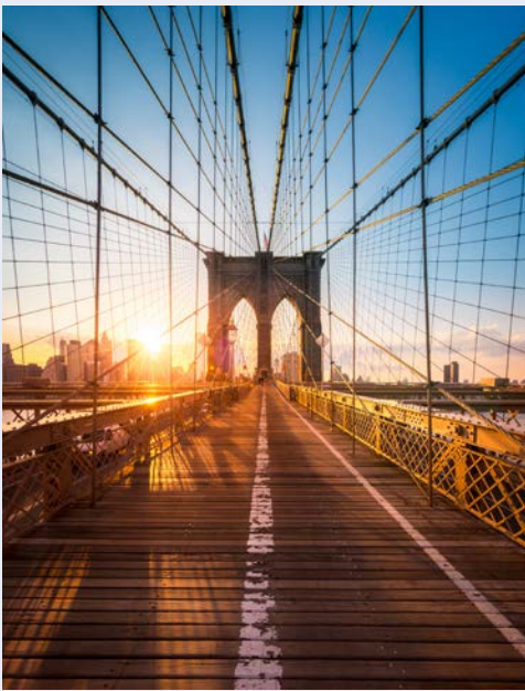
Die Brooklyn Bridge

Ungewöhnlicher und kontrastreicher kann der heutige Kunstgenuss nicht sein. Mit der Überquerung des East River erreichen Sie den größten New Yorker Stadtteil Brooklyn. Etwa 3 Millionen Menschen leben hier in unterschiedlichsten Stadtteilen mit starken ethnischen und architektonischen Kontrasten. Zunächst gilt jedoch Ihre Aufmerksamkeit dem Brooklyn Museum. Geplant und 1887 eröffnet als das weltweit größte Museum, zählt es heute zu den größten und ältesten Kunsthäusern Nordamerikas. Im Rahmen einer Highlight-Führung sehen Sie einen