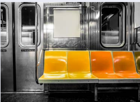
Die New Yorker Subway