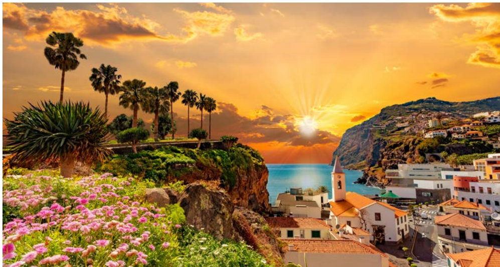
Câmara de Lobos