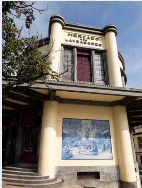
Die Markthalle in Funchal

Alternativ fahren Sie zunächst zum Hafen und dann mit der Fähre nach Porto Santo (ca. 2,5 Stunden). Dort begrüßt Sie die örtliche deutschsprachige Reiseleitung und Sie begeben sich eine auf Inselrundfahrt. Am Nachmittag entspannen Sie am 9 km langen Strand Praia do Porto Santo oder unternehmen ausgedehnte Strandspaziergänge. Erkunden Sie auf eigene Faust die Sehenswürdigkeiten der Inselhauptstadt, die sich um den Marktplatz gruppieren. Mit der Fähre geht es dann wieder zurück nach Madeira.