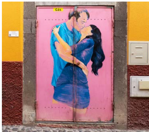
In der Altstadt von Funchal

Nach Ihrer Ankunft in Funchal erfolgt ein kurzer Transfer zu Ihrem Hotel. Die Blumeninsel begrüßt Sie bereits auf diesem kurzen Weg mit ihrer Pflanzen- und Farbenvielfalt. Vor dem Abendessen freut sich Ihre Reiseleitung auf das Kennenlernen beim landestypischen Begrüßungscocktail. Das erste Abendessen lässt die Urlaubswoche gut beginnen.