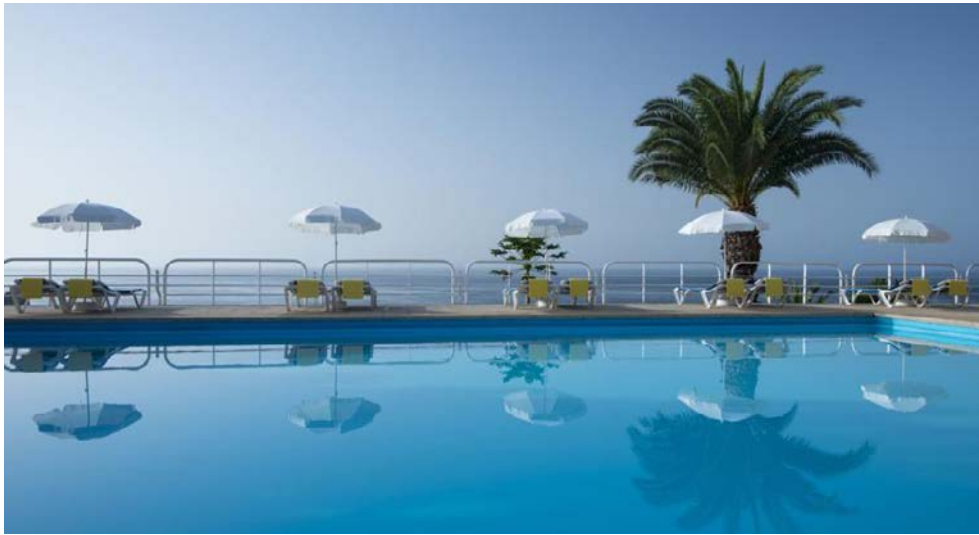
Hotel Baia Azul – Hotelpool